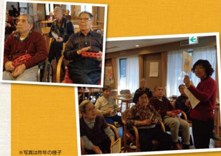
※写真は昨年の様子

懐かしい唄を大きな声で歌ってストレス発散!音楽に合わせて体を動かしダイエット!楽器を使い演奏会。ノリノリで和気あいあいとした時間を過ごしませんか?