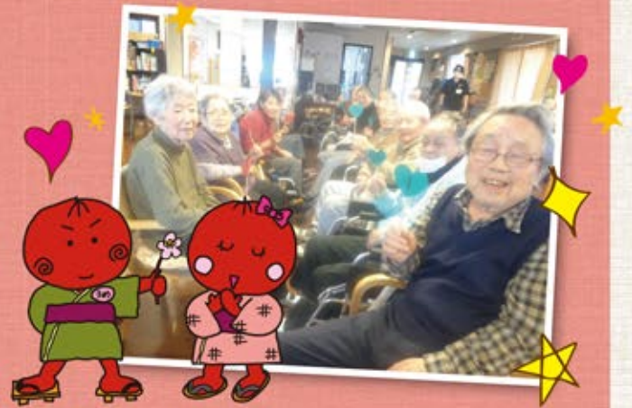
※写真は昨年の様子です

年に一度の告白の日。気になるあの方の隣で、ドキドキしながらお茶でもしませんか?あまーいお菓子と美味しいお茶をご用意してお待ちしております。