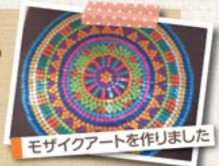
モザイクアートを作りました