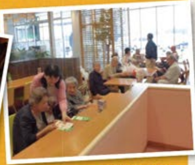
※写真は前回の様子