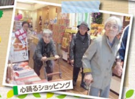
心踊るショッピング