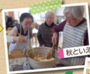
秋といえば芋煮会