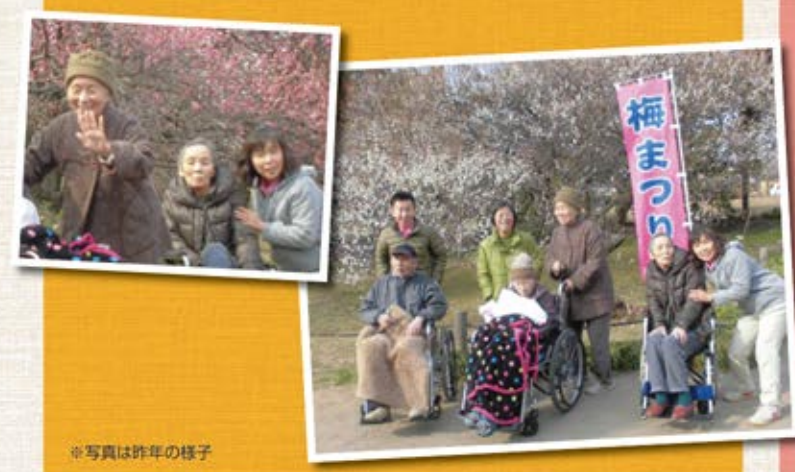
※写真は昨年の様子

2月も終盤に差し掛かり、そろそろ梅の花がほころび始める頃。越谷梅林公園へ出かけましょう。梅の花は目に美しく、何ともいえぬ良い香り! 誰もが好きな花のひとつですね! 当日の開花状況は未定ですが、今年も綺麗な花を咲かせてくれることを期待しましょう!