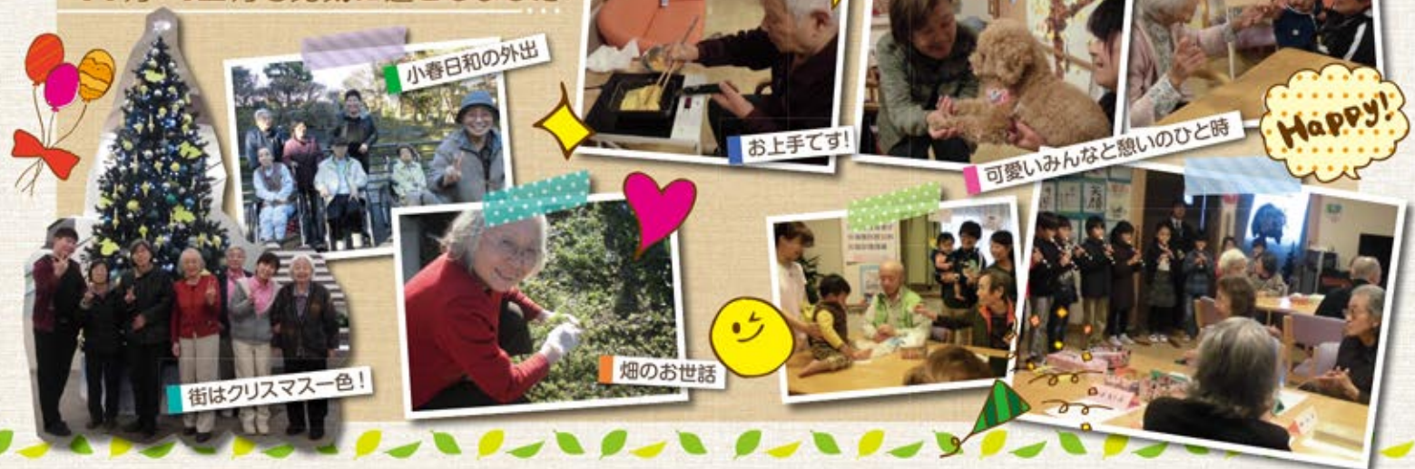
街はクリスマス一色!