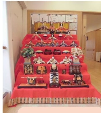
♪明かりをつけましょ ぼんぼりに〜♪