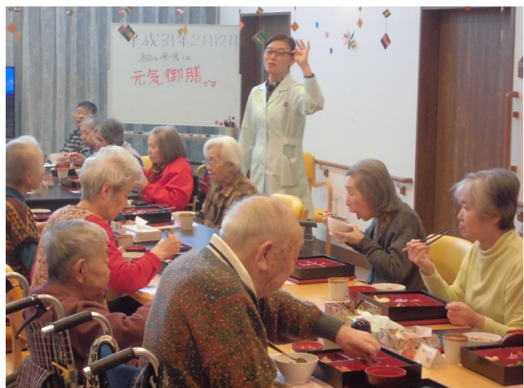
「美味しい！美味しい！」箸が止まりません