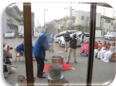
女性スタッフも「ペッたんペッたん」 力強いです!(^^)!