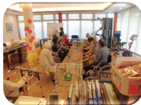
有料VSデイサービス