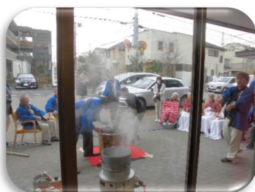
美味しいお餅にな～れ (*A-A*)