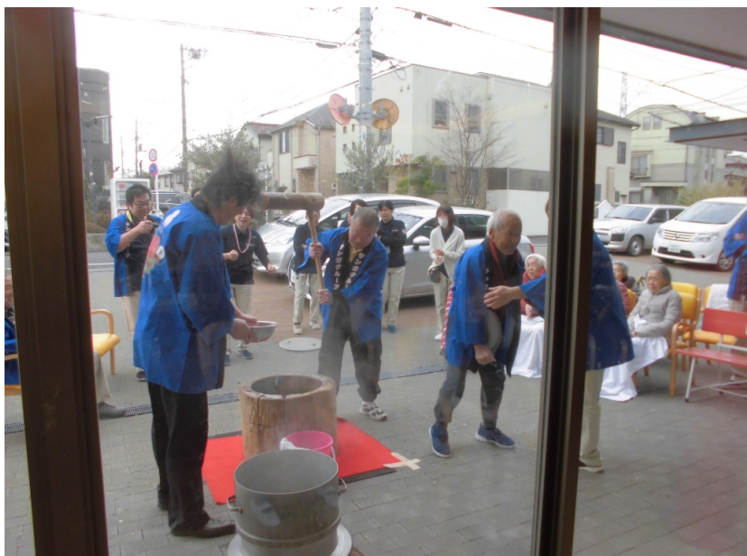
法被を着て勇ましい男衆(^_^)☆

そこで、祝い事や特別な日であるハレの日に、餅つきをするようになりました。餅つきは一人ではできないため、皆の連帯感を高め、喜びを分かち合うという社会的意義もあります。