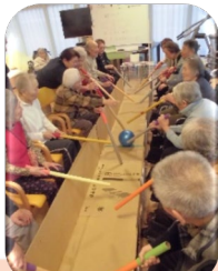
新競技 棒サッカー