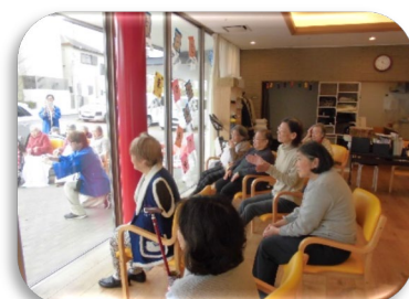
女性陣の応援に力が入ります (#A^#)