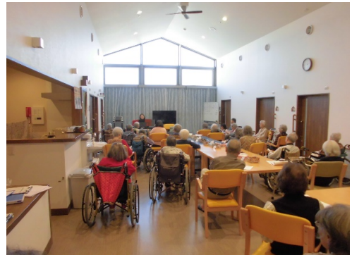
チェロとピアノの演奏会 素晴らしい演奏でした